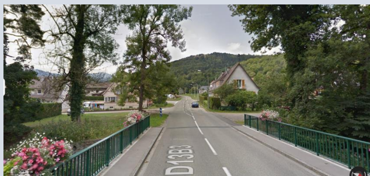
Photo du pont de la Thur à la rue de la Gare

Dans le cadre d'un programme national de contrôle d'état de santé des ponts, notre commune ressort avec un carnet vierge. Aucun travaux n'est à prévoir. Les ponts contrôlés sont ceux de la rue des Cerfs, rue de Mitzach, rue du Brand, rue de la Gare, Grand'rue et celui de l'ancien canal de déviation de la Thur.