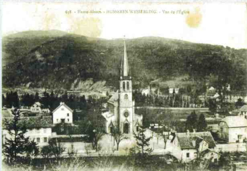
(Husseren-Wesserling 1905)